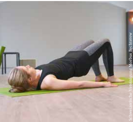
Schweizerische Vereinigung Morbus Bechterew

Die Schweizerische Vereinigung Morbus Bechterew hat in Zusammenarbeit mit der Zürcher Hochschule für Angewandte Wissenschaften (ZHAW) das Projekt «Rheumafit» ins Leben gerufen. Die Internetplattform www.rheumafit.ch bietet Übungsprogramme, die für Menschen mit Morbus Bechterew und anderen rheumatischen Erkrankungen geeignet sind. Daneben finden sie wichtige Tipps und Hinweise für das Training zu Hause. www.rheumafit.ch